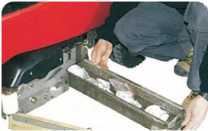
Edelstahl-Kehr-Walzenschrubbaggregat mit Grobschmutzsammelbehälter

Metro 1102 RN - mit zwei Walzenbürsten und einem Kehrbehälter und einer Arbeitsbreite von 110 cm