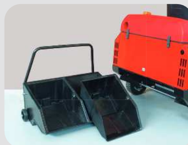
Serienmäßig sind zwei Behältereinätze zur Gewichtsverteilung enthalten.