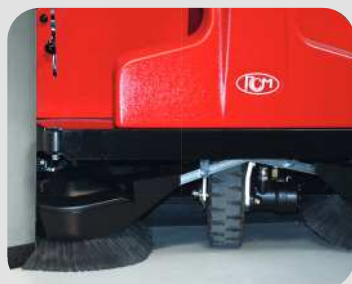
Pendelnder Seitenbesen weicht Hindernissen aus